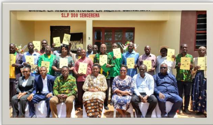
Waziri wa Ardhi Nyumba na Maendeleo ya Makazi Dkt Angeline Mabula akiwa na wakazi wa wilayani ya Sengerema mkoani Mwanza baada ya kuzindua Baraza la Ardhi na Nyumba la Wilaya na kugawa miongozo ya uendeshaji wa Mabaraza tarehe 21 Machi 2022.

39. Mheshimiwa Spika , ili kusogeza huduma karibu na wananchi, Wizara katika mwaka 2021/22 iliahidi kuongeza idadi ya Mabaraza yanayotoa huduma ambapo hadi kufikia tarehe 15 Mei, 2022, Mabaraza mapya 20 yameanza kutoa huduma na hivyo kuwa na jumla ya Mabaraza 80 yanayotoa huduma kati ya Mabaraza 139 yaliyoanzishwa. Katika mwaka 2022/23, Wizara inatarajia kushughulikia mashauri 33,250 na itawezesha Mabaraza mapya 59 kuanza kutoa huduma na hivyo kuwa na Mabaraza yanayotoa huduma katika Wilaya zote nchini.