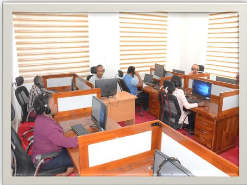
Kituo cha mawasiliano kwa wateja kilichopo Mtumba Jijini Dodoma

27. Mheshimiwa Spika , katika mwaka 2021/22, Wizara ilipanga kutatua migogoro ya ardhi 1,000 kiutawala. Hadi kufikia tarehe 15 Mei, 2022 migogoro 1,898 kati ya migogoro 1,635 iliyopokelewa na kutatuliwa ( Jedwali Na.4 ). Aidha, Wizara iliendelea na utaratibu wa kutatua migogoro ya ardhi inayowasilishwa na wananchi.