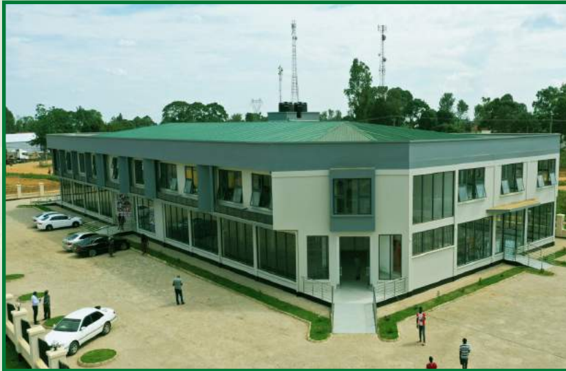
Muonekano wa Jengo la Kitega Uchumi la Shirika la Nyumba la Taifa (NHC) lililopo mpaka wa Tanzania na Uganda eneo la Mutukula Wilaya ya Misenyi mkoani Kagera.