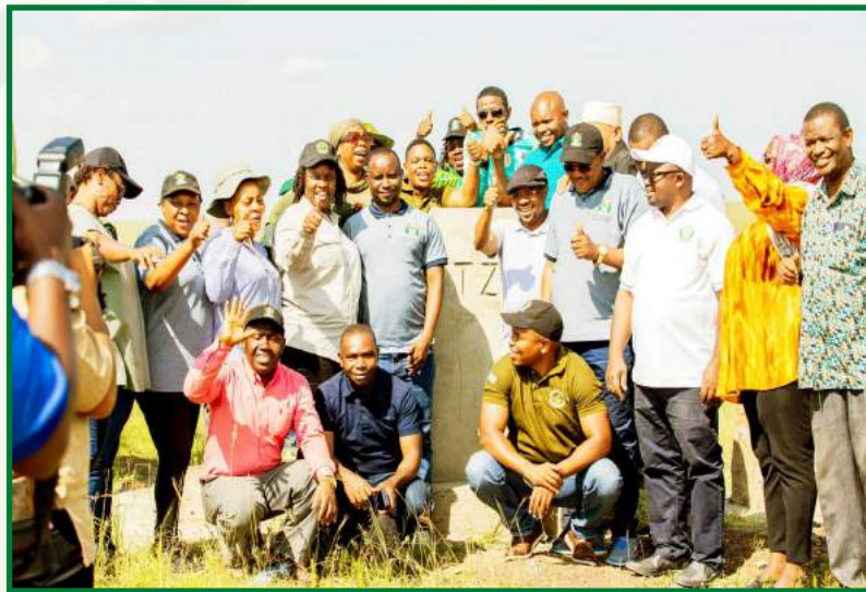
Naibu Waziri wa Ardhi Nyumba na Maendeleo ya Makazi Mhe. Ridhiwani Kikwete akiwa na baadhi ya wajumbe wa Kamati ya Kudumu ya Bunge ya Ardhi Maliasili na Utalii katika mpaka wa Tanzania na Kenya ndani ya mbuga ya Serengeti mkoani Mara.