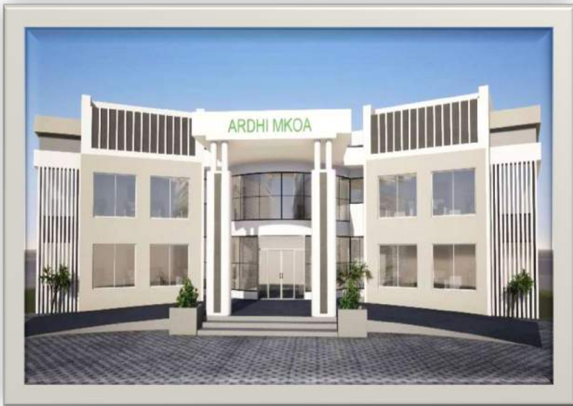
Mchoro wa Jengo la Ofisi za Ardhi zinazotarajiwa kujengwa katika mikoa 25 nchini

87. Mheshimiwa Spika , katika mwaka 2022/23, Wizara imepanga kujenga majengo ya Ofisi za Ardhi za Mikoa 25 ; kuboresha mfumo wa ILMIS; kutoa Hatimiliki 150,000 katika Halmashauri 10 ; kutoa Hati za Hakimiliki za Kimila 50,000 katika Vijiji 50 ; kuandaa Mipango ya Matumizi ya Ardhi ya Vijiji 50 katika Wilaya sita ( 6 ) na Mipango ya Matumizi ya Ardhi ya Wilaya hizo; na kutoa Leseni za Makazi 250,000 . Katika utekelezaji wa kazi hizi, Wizara inatarajia kutoa fursa za ajira za muda mfupi 2,300 na vibarua 4,200 .