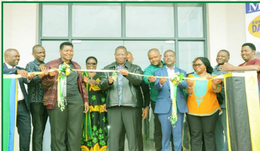
Makamu wa Rais wa Jamhuri ya Muungano wa Tanzania Mhe. Dkt. Philip Mpango (katikati) akizindua Jengo la Kitega Uchumi la Shirika la Nyumba la Taifa (NHC) lililopo mpaka wa Tanzania na Uganda eneo la Mutukula Wilaya ya Misenyi mkoani Kagera tarehe 18 Machi 2022. Kulia kwake ni Waziri wa Ardhi, Nyumba na Maendeleo ya Makazi Mhe. Dkt. Angeline Mabula pamoja na viongozi wengine.