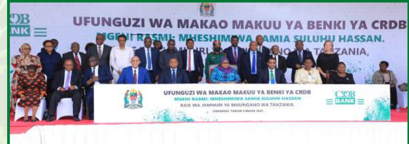
Rais wa Jamhuri ya Muungano wa Tanzania, Mhe. Samia Suluhu Hassan akiwa kwenye picha ya pamoja na Viongozi mbalimbali wakati wa uzinduzi wa jengo la Makao Makuu ya Benki ya CRDB, lililosanifiwa na Shirika la Nyumba la Taifa (NHC), Jijini Dar es Salaam.