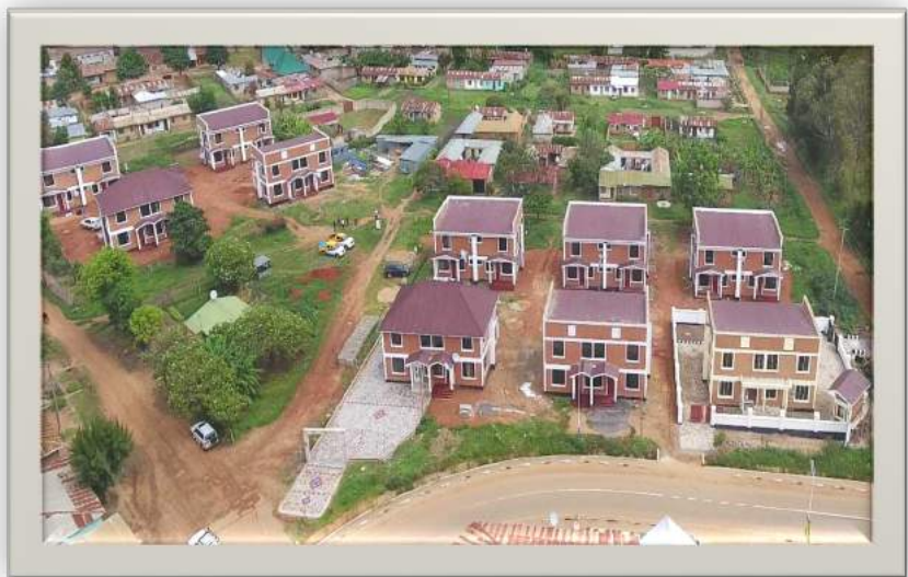
Ujenzi wa nyumba za gharama nafuu katika Halmashauri za Sumbawanga