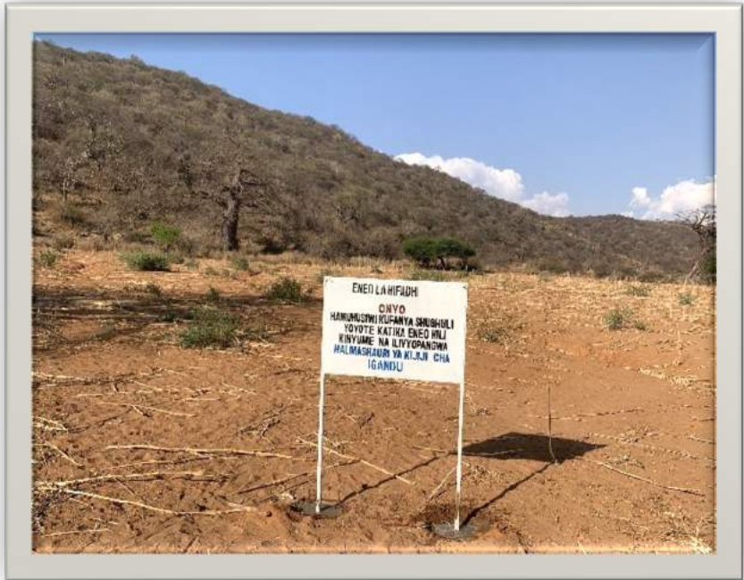
Bango linaloonyesha moja ya eneo lillotengwa kwa ajili ya Uhifadhi lililosimikwa mara baada ya kuandaa mpango wa matumizi ya ardhi ya kijiji cha Igandu Wilayani Chamwino likionyesha kupiga marufuku shughuli yoyote katika eneo hilo

na wadau mbalimbali nchini. Mipango hii inawezesha kutenga maeneo kwa ajili ya matumizi mbalimbali ya ardhi ikiwemo makazi, kilimo, nyanda za malisho, uwekezaji, uhifadhi, ardhi ya akiba na mapito ya wanyamapori. Mipango hiyo inawezesha kudhibiti migogoro ya ardhi, kulinda ikolojia na mazingira, kutoa milki salama kwa wananchi na hivyo kuongeza tija katika matumizi ya ardhi, uzalishaji mali na kuinua uchumi wa jamii na Taifa.