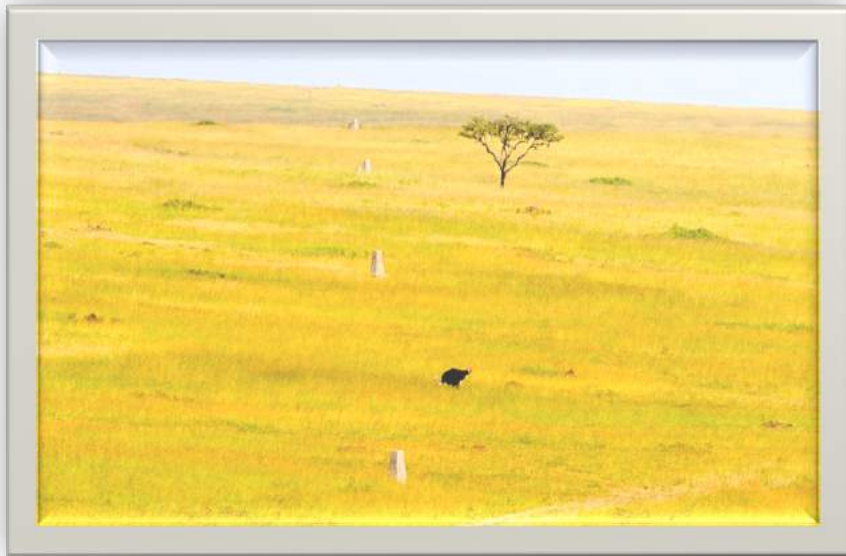
Alama za mpaka wa Kimataifa kati ya Kenya na Tanzania uliopo Serengeti Mkoani Mara