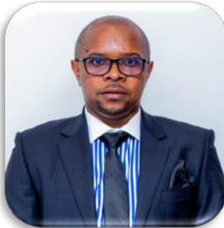
MHE. RIDHIWANI JAKAYA KIKWETE (MB.) NAIBU WAZIRI