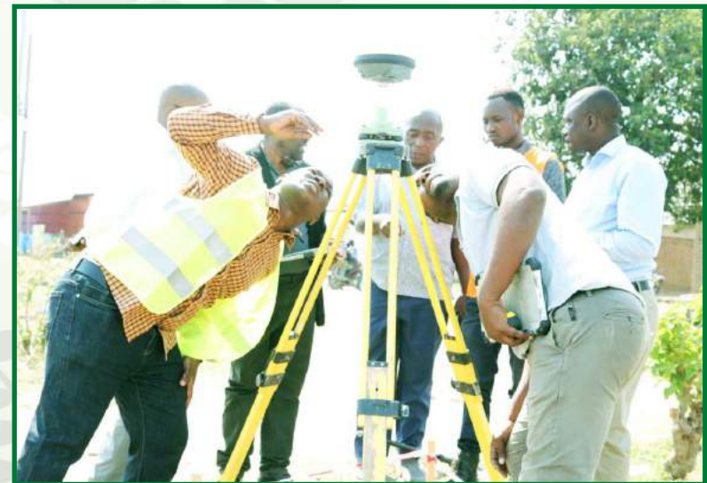
Wataalamu kutoka chuo cha Ardhi Morogoro (ARIMO) wakiwa katika matayarisho ya awali ya kazi ya urasimishaji makazi holela katika mji mdogo wa Mbalizi mkoani Mbeya.