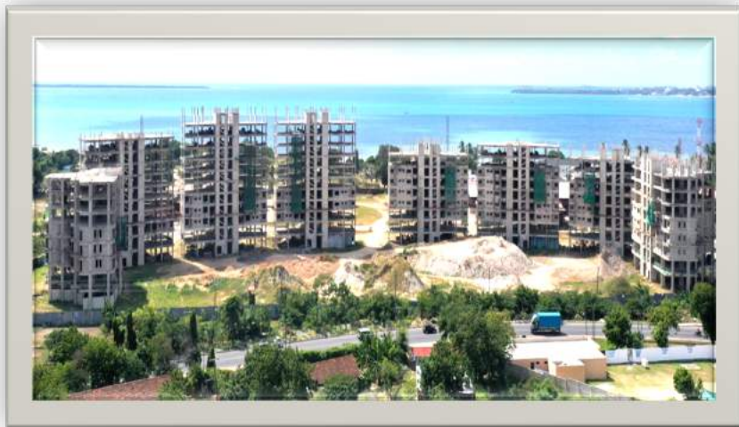
Maendeleo ya mradi wa Ujenzi wa (Satellite Town) Kawe jijini Dar es salaam