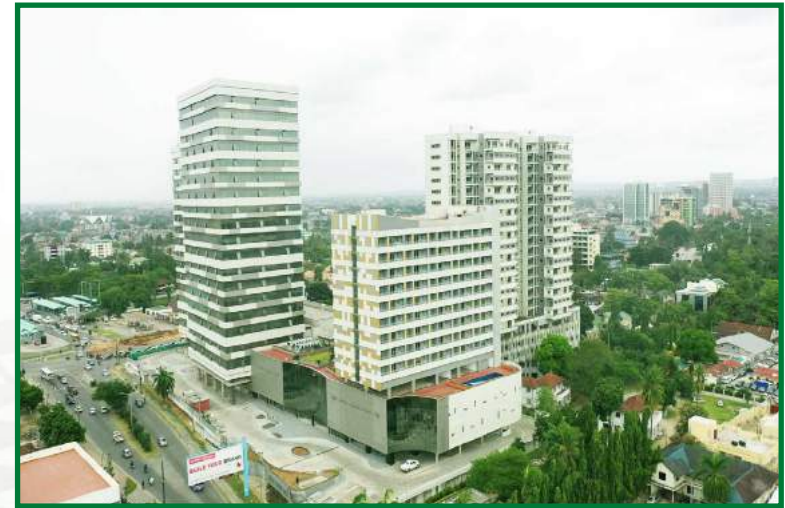
Maendeleo ya Ujenzi wa Mradi wa Morocco Square unaotekelezwa na Shirika la Nyumba la Taifa (NHC)