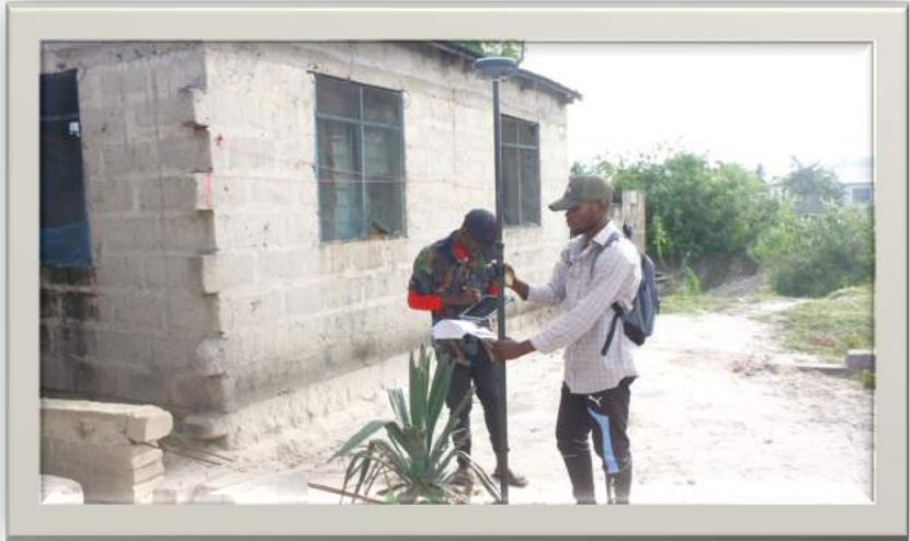
Kazi ya urasimishaji makazi ya wakazi wa Kivule Jijini Dar es salaam likiendelea