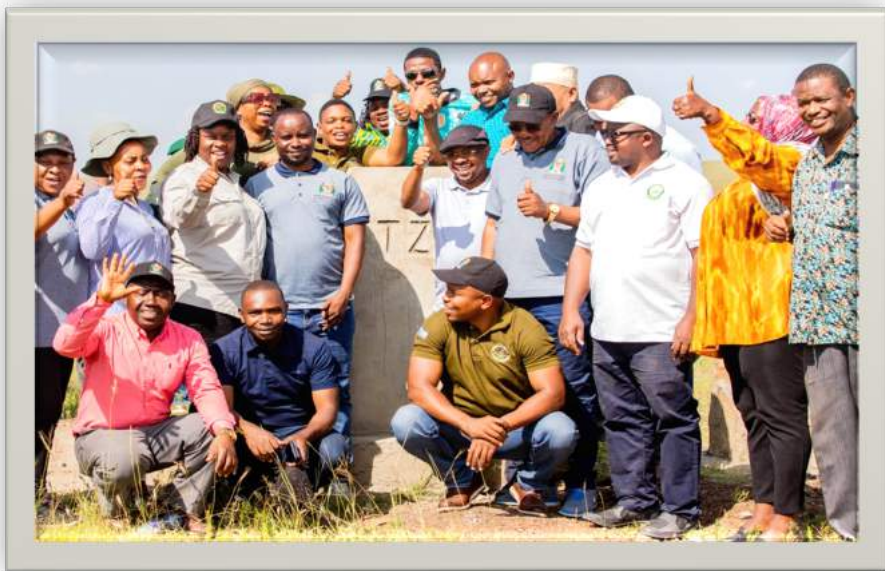
Naibu Waziri wa Ardhi Nyumba na Maendeleo ya Makazi Mhe. Ridhiwani Kikwete akiwa na baadhi ya wajumbe wa Kamati ya Kudumu ya Bunge ya Ardhi Maliasili na Utalii katika mpaka wa Tanzania na Kenya ndani ya mbunga ya Serengeti mkoani Mara.

88. Mheshimiwa Spika , katika mwaka 2021/22, Wizara iliahidi kuendelea na uimarishaji wa mipaka ya nchi kavu yenye urefu wa kilometa 100 kati ya Tanzania na Burundi na kilometa 128 kati ya Tanzania na Kenya kwa kushirikiana na mamlaka za Serikali za nchi hizo. Napenda kuliarifu Bunge lako Tukufu kuwa hadi tarehe 15 Mei, 2022, kilometa 83 za mpaka wa Tanzania na Kenya zimeimarishwa na kazi inaendelea. Pia, ramani za msingi za mpaka kwa kipande cha kilometa 238 kutoka Ziwa Viktoria hadi Ziwa Natron ambazo zitatumika kuandaa Mkataba wa mpaka zimeandaliwa.