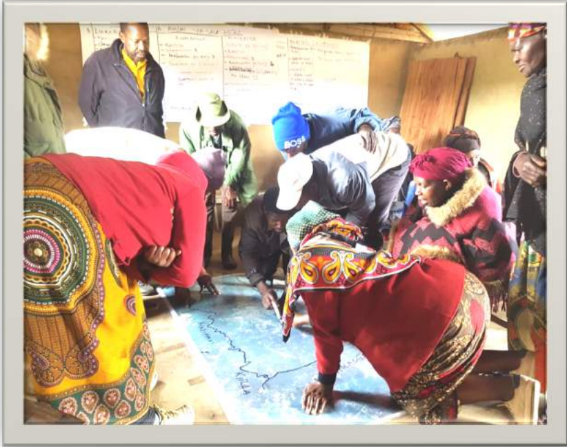
Baadhi ya wananchi wa kijiji cha Lumage wilayani Makete wakishiriki zoezi la uandaaji wa mpango wa matumizi ya ardhi kwa kutumia picha ya anga (satellite image)