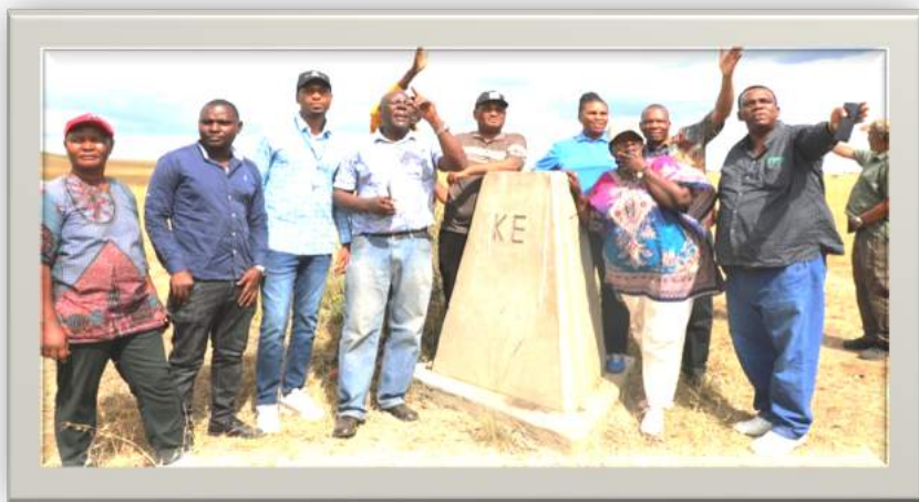
Timu ya Wataalam wa upimaji kutoka nchi za Tanzania na Kenya ikiangalia muelekeo wa mpaka wa nchi hizo katika eneo la Serengeti/ Masai Mara.