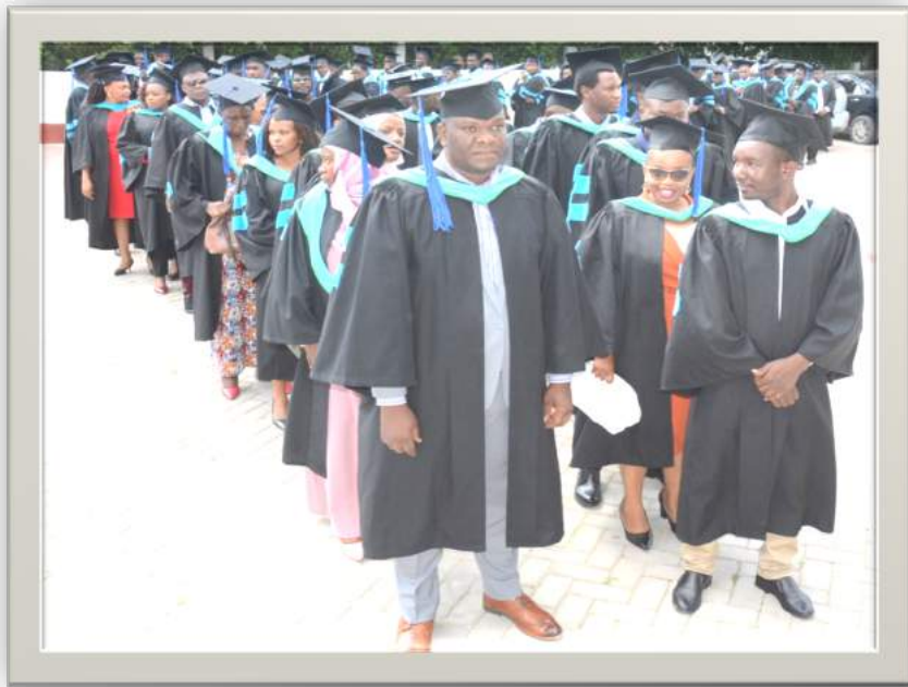
Baadhi ya Wahitimu wa Mafunzo ya Usajili wa Kudumu wa Uthamini kwa mwaka 2022.