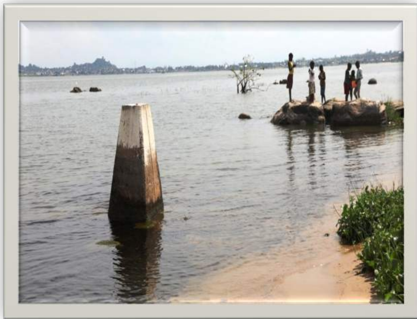
Muonekano wa alama ya mpaka ardhini (BP MWISHONI) eneo la Kirongwe lililopo wilaya ya Rorya mkoani Mara na Muhuru Bay iliyopo Kaunti ya Migori upande wa Kenya.

hurahisisha kazi, kupunguza muda na gharama za upimaji ardhi. Katika mwaka 2021/22, Wizara iliahidi kusimika alama mpya za msingi 80 katika maeneo mbalimbali nchini. Hadi kufikia tarehe 15 Mei, 2022 alama za msingi za upimaji 68 zilisimikwa katika Mikoa ya Dar es Salaam (5), Arusha (8), Dodoma (11), Mara (7), Njombe (8), Simiyu (3), Kigoma (8), Manyara (5), Tanga (5), na Geita (8) na hivyo kuwa na alama za upimaji 935 nchini. Katika mwaka 2022/23 Wizara itasimika alama mpya za msingi 80 .