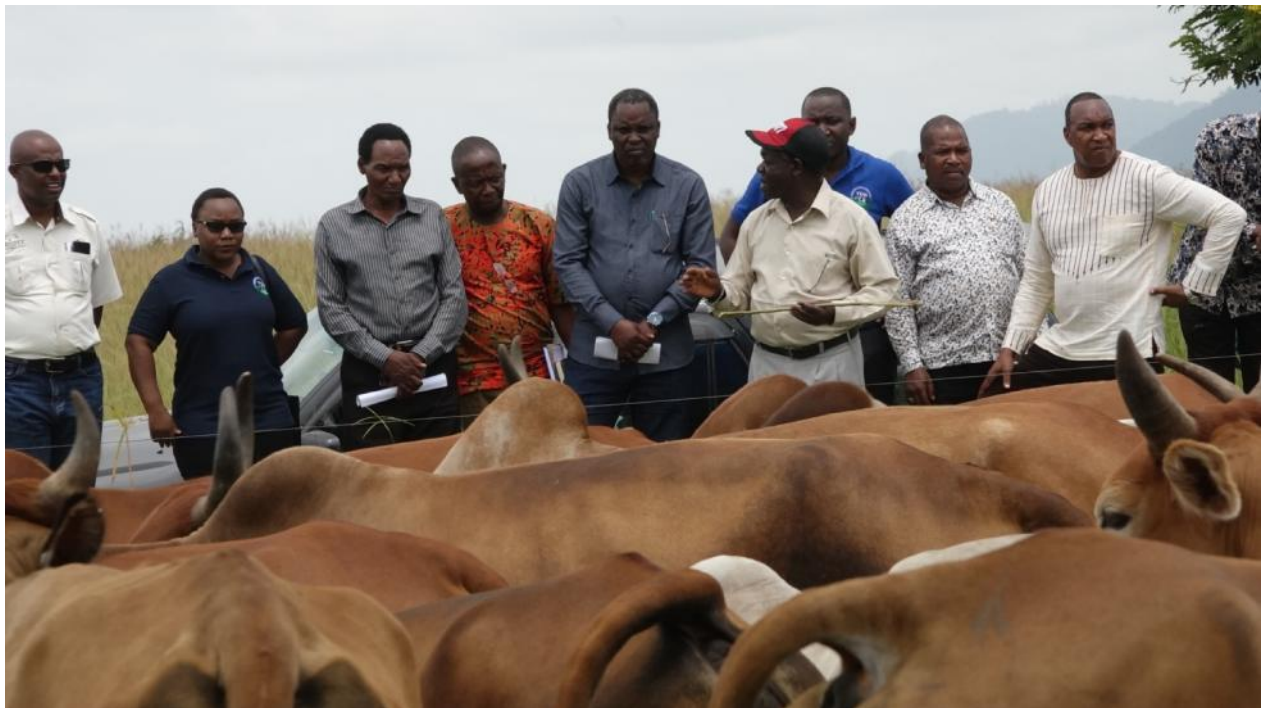
Waziri wa Mifugo na Uvuvi, Mhe. Mashimba Mashauri Ndaki akisikiliza maelezo kutoka kwa Meneja wa Shamba la kuzalisha mitamba ya ng'ombe wa maziwa la Mruazi, Tanga