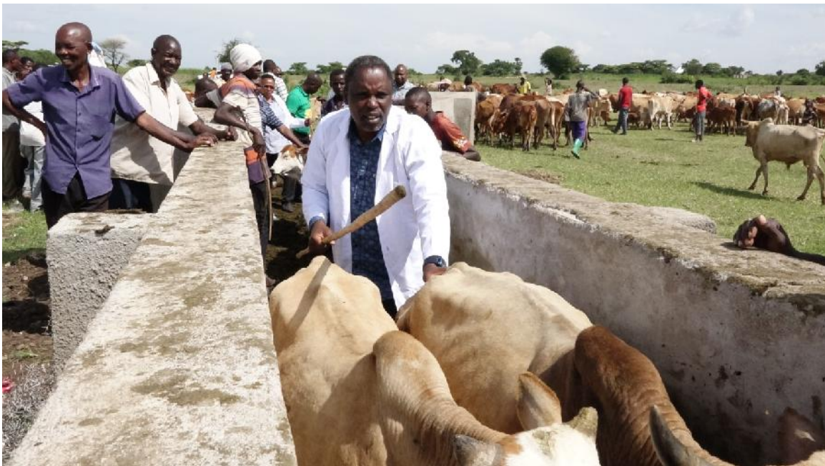
Waziri wa Mifugo na Uvuvi Mhe. Mashimba Ndaki (aliyeshika fimbo) akiwaongoza ng'ombe katika joshu la Kijiji cha Kinango kilichopo Wilaya ya Magu Mkoani Mwanza, wakati wa zoezi la kuogesa mifugo