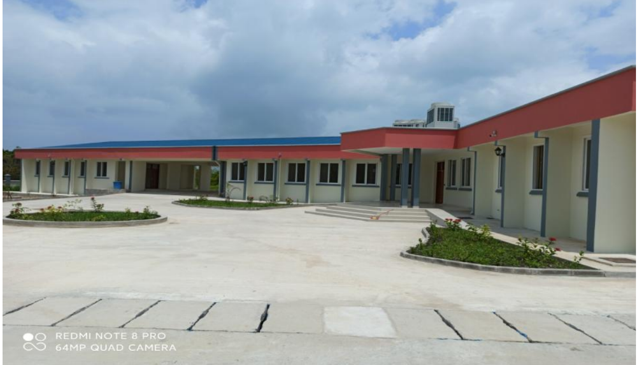
Jengo la Maabara Mpya ya TAFIRI, Kunduchi, Dar es Salaam. Maabara hii itawezesha utafiti wa uvuvi na ukuzaji viumbe maji.