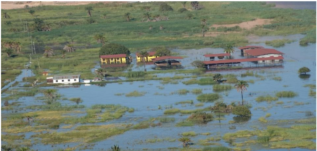
Miundombinu ya Mwalo wa Kasanga uliopo Wilaya ya Kalambo ikiwa imezingirwa na maji kutokana na mafuriko yaliyotokana na mvua kubwa iliyonyesha katika msimu wa mwaka 2020 Miundombinu ya Mwalo wa Kasanga uliopo Wilaya ya Kalambo ikiwa imezingirwa na maji kutokana na mafuriko yaliyotokana na mvua kubwa iliyonyesha katika msimu wa mwaka 2020